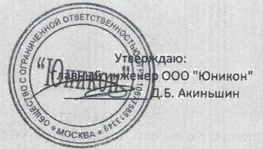
ГРАФИК № 1 проведения технического обслуживания внутриквартирного газового оборудования в декабре 2018 года по АО "ЛГЖТ"