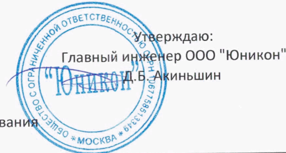
ГРАФИК № 4 проведения технического обслуживания внутриквартирного газового оборудования в апреле 2018 года по АО \"ЛГЖТ\"