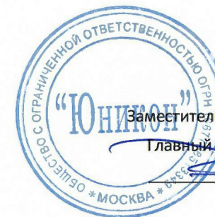
ГРАФИК проведения технического обслуживания внутриквартирного и внутридомового газового оборудования в МКД Можайского городского округа, находящихся в управлении ООО «Комфортный Можайск» на ноябрь 2022 года