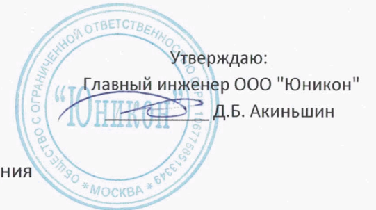
ГРАФИК №1 проведения технического обслуживания внутриквартирного газового оборудования в июне 2018 года по МП "ДЕЗ ЖКУ"